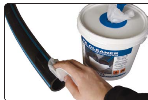
Bild 3. (Servetthink. RSK-nr: 242 89 65)