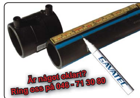
Bild 4. (Penna. RSK-nr: 242 83 61)

Är något oklart? Ring oss på 046 - 71 30 80